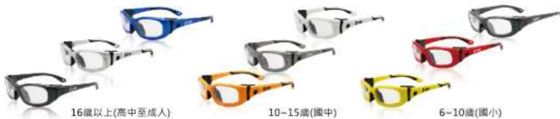
16歲以上(高中至成人)

通過網球、壁球、羽球、手球、足球和籃球安全標準認證測試 耐撞擊彈性科技框材 防爆/抗藍光/抗UV400/防霧鏡片 避震鼻墊、側墊與防滑腳墊