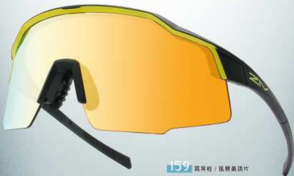
159 霧黑框 / 風暴黃鏡片